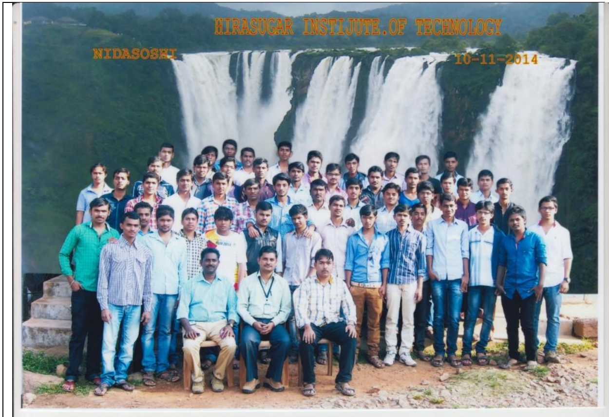
65 (students and Staff) are visited Sharavati spot on 10-11-2014 and observed the spot.