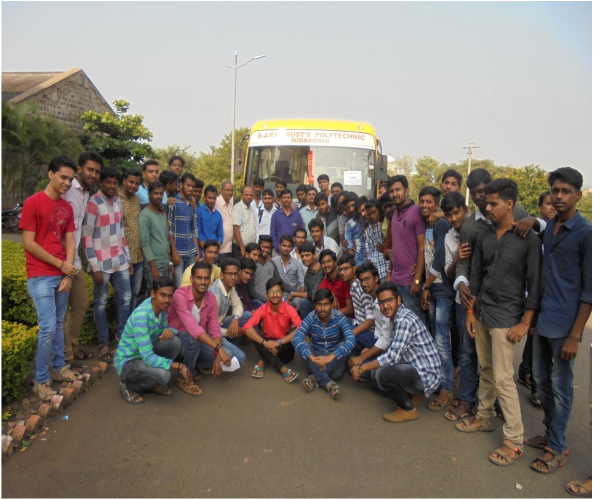
109 students are visited supra dam on 26-10-2017 and observed hydroelectric power plant.