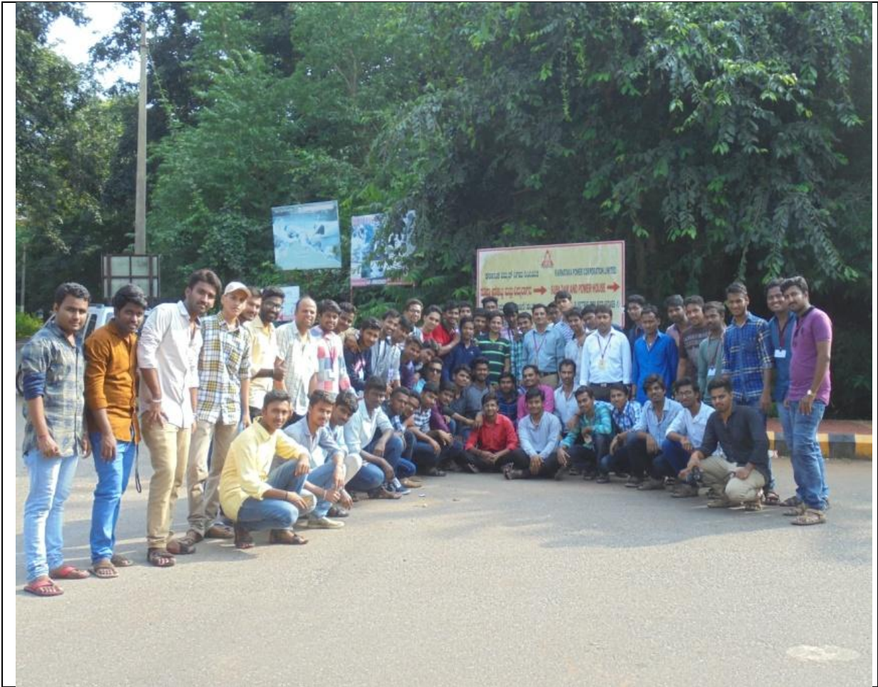
109 students are visited supa dam on 26-10-2017 and observed hydroelectric power plant.