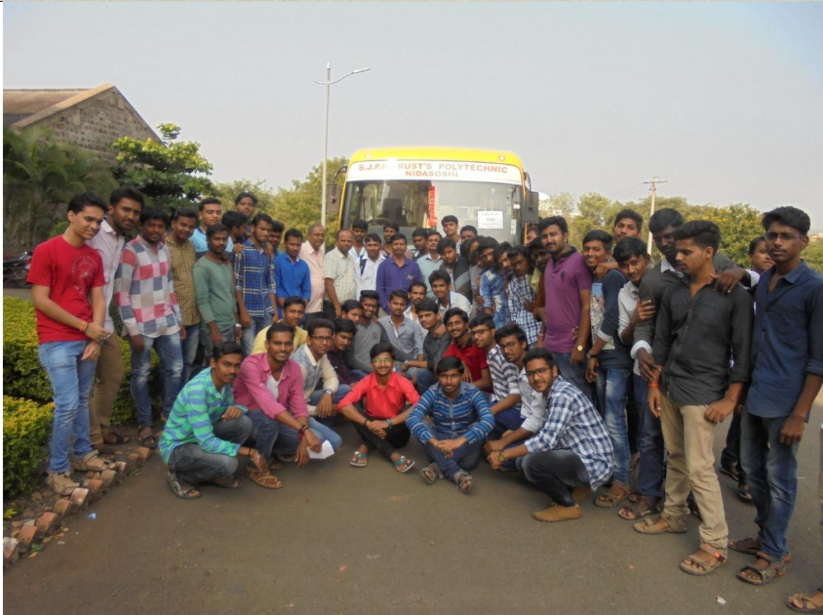
Students are visited supra dam on 26-10-2017 and observed hydroelectric power plant.