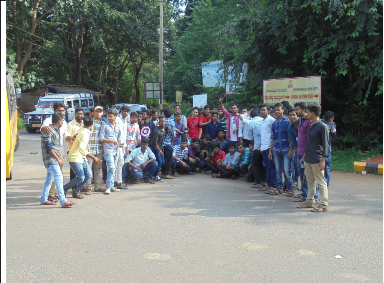
56 Students are attended Supa dam power plant and observed the power plant.