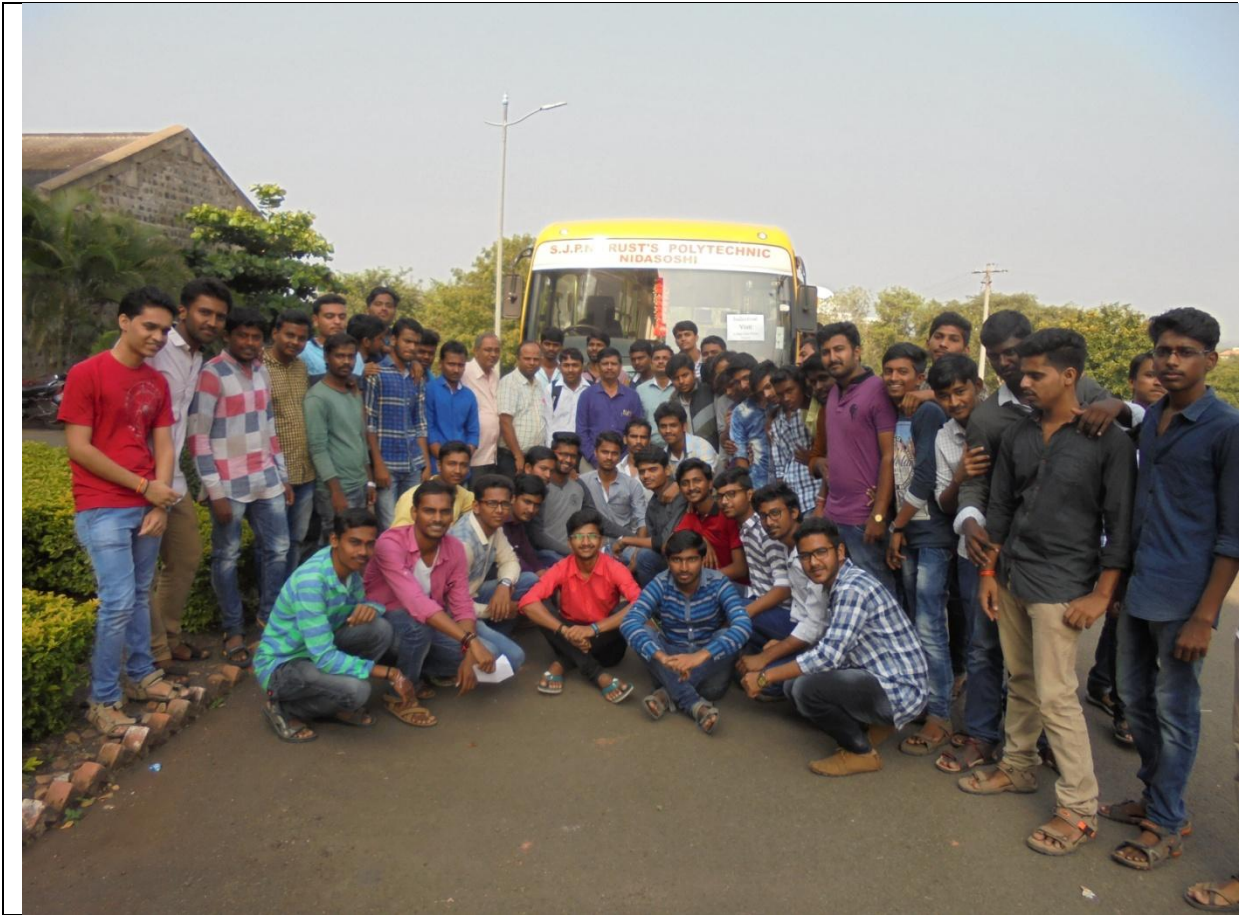
56 Students are attended Supa dam power plant and observed the power plant.