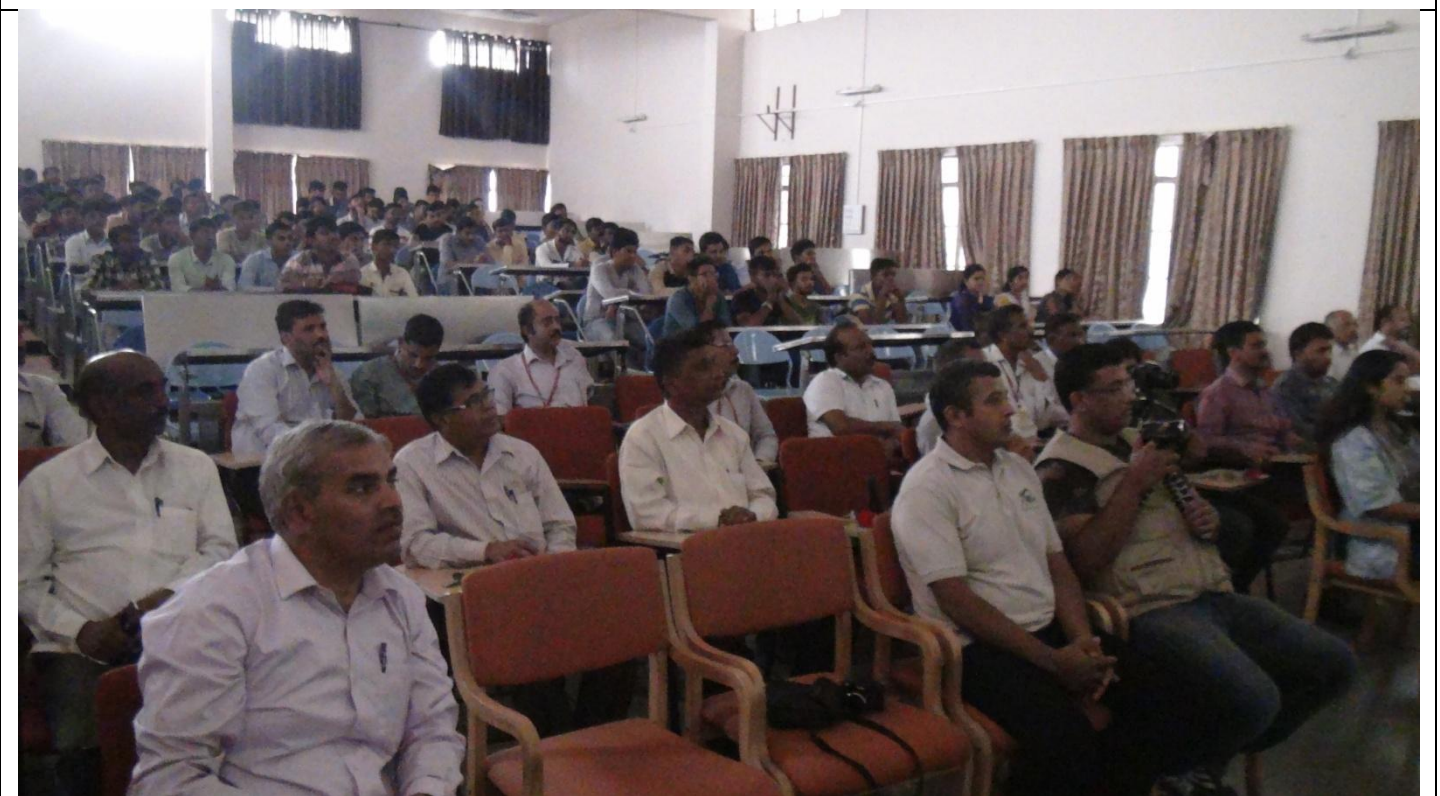
Photo of 4 th and 6 th semester Mechanical Engineering students and staff attending seminar on "forest and wild life conservation" on 10 th February 2018 in Mechanical Engineering Department HSIT Nidasoshi